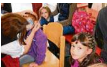
Wieder ein Spaß für die Kleinen: Das Kinderschminken.